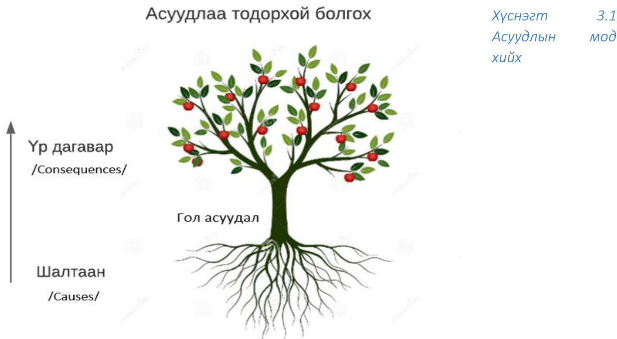
Зураг 1. Асуудлын мод

Ингэхдээ тулгарч буй асуудлыг томъёолох “Асуудлын мод” арга хэрэглэнэ.