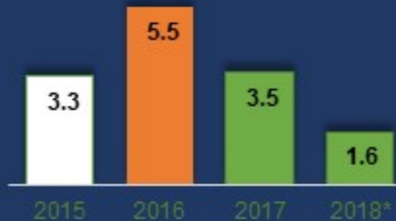
Их наяд төгрөгөөр

Өндөр хүүтэй үнэт цаасыг хугацаанаас өмнө буцаан худалдан авч, арилжааг зогсоон 2017 онд 3.5 их наяд төгрөг байсныг 2018 оны эцэст 1.6 их наяд төгрөг болгон 3.0 их наяд төгрөгөөр бууруулав.