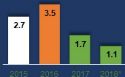
Их наяд төгрөгөөр

Засгийн газрын өрийн баталгаа 2016 онд 3.5 их наяд төгрөгт хүрээд байсан. Шинээр баталгаа гаргахгүй байх, гаргасан баталгааны эргэн төлөлтөд тогтмол хяналт тавьж ажилласны үр дүнд баталгааны үлдэгдэл 1.1 их наяд төгрөг болж өмнөх оноос 0.6 их наяд төгрөгөөр буураад байна.