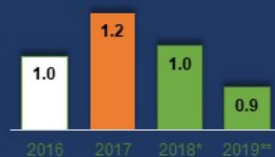
Их наяд төгрөгөөр

ЗГ-ын өрийн хүүгийн зардлыг 285.1 тэрбум төгрөгөөр бууруулж 865.6 тэрбум төгрөг , ЗГ-ын өрийн ӨҮЦ-ээр үлдэгдэлийг ДНБ-д харьцуулсан харьцааг 2021 онд 41.0 хувьд хүргэхээр тусгав.